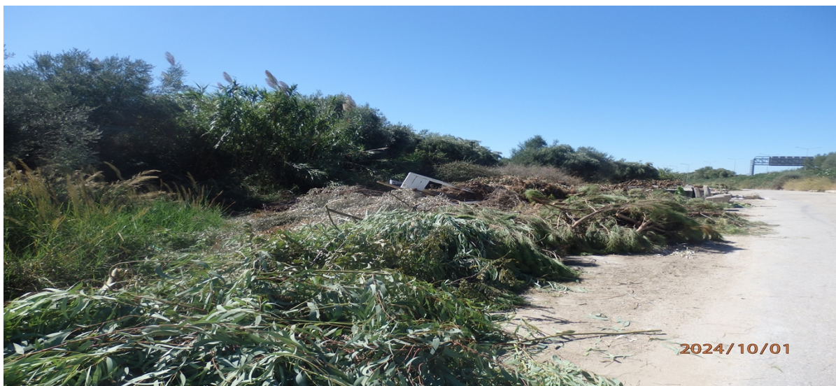
Εικόνα 2: Φωτογραφική απεικόνιση του χώρου με στερεά απόβλητα κήπων και αστικών στερεών αποβλήτων