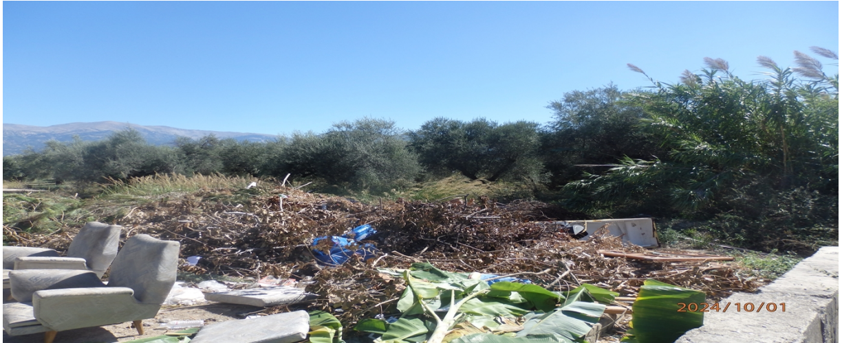
Εικόνα 3: Φωτογραφική απεικόνιση με ογκώδη οικιακά αντικείμενα και ξερά κλαδιά